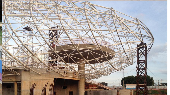
cubierta metálica espacial